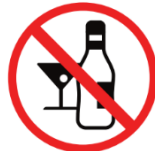
alkoholische Getränke alcoholic drinks