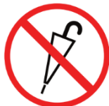
Stockregenschirme stick umbrellas