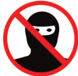
Vermummungsverbot ban of face coverings