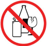
Glasbehälter, Flaschen, Dosen glassware and bottles