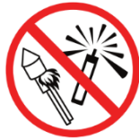
Feuerwerkskörper, Leuchtkugeln, Rauchpulver, Rauchbomben, pyrotechnische Gegenstände pyrotechnic objects