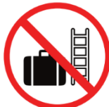
sperrige Gegenstände (z.B. Koffer, Kisten, Leitern etc.) bulky objects (e.g. cases, boxes, ladders)