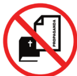
werbende, kommerzielle, politische oder religiöse Gegenstände promotional, commercial, political or religious items