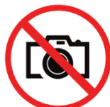
Foto- und Videokameras für gewerbliche Zwecke cameras, video cameras for commercial purposes

Wir wünschen viel Spaß beim Supercup der Frauen und einen angenehmen Aufenthalt!