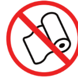
Papierrollen paper rolls