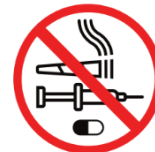
Drogen jeglicher Art drugs