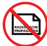
rassistisches, fremdenfeindliches, extremistisches, diskriminierendes, radikales oder politisches Propagandamaterial racist, xenophobic, extremist, discriminatory, radical, political material to make propaganda