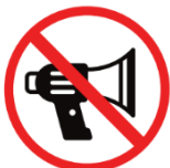
mechanische oder elektrisch betriebene Lärminstrumente mechanical or electric devices to make noise