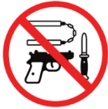
Waffen, gefährliche Gegenstände weapons, dangerous objects

Die Mitnahme von Cannabis ist untersagt!