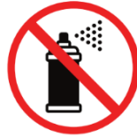
Gassprühdosen, ätzende oder färbende Substanzen aerosol spray cans, caustic and/or staining liquids